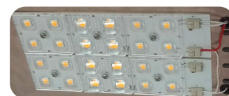
Utskiftbar LED modul