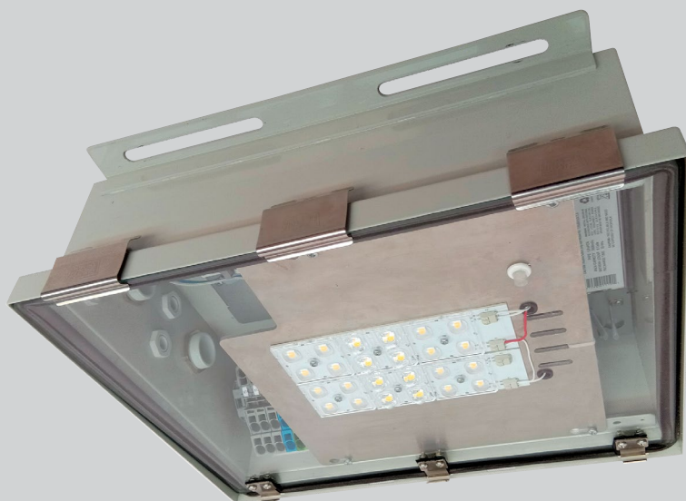
Tunn LT G2 – solid LED armatur i syrefast stål for lavtrafikkerte tunneler og tøft industrimiljø