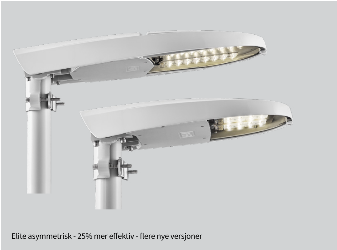
Elite asymmetrisk - 25% mer effektiv - flere nye versjoner