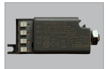
10kV overspenningsvern med LED indikator