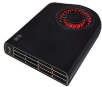
Termini™ II 1900