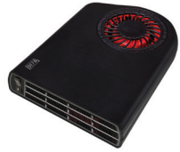
Termini™ II 1900