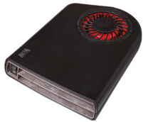
Termini™ II 1400