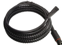
Termini™ sisätilanlämmittimen jatkojohto