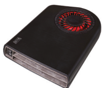
Termini™ II 1400