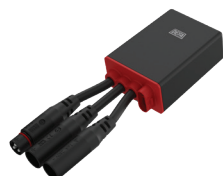
MultiCharger 1205R Flex