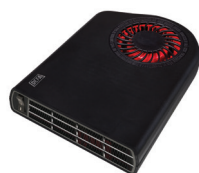
Termini™ II 1900