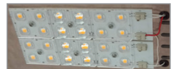
Utbytbar LED modul.