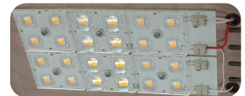
Utbytbar LED modul.