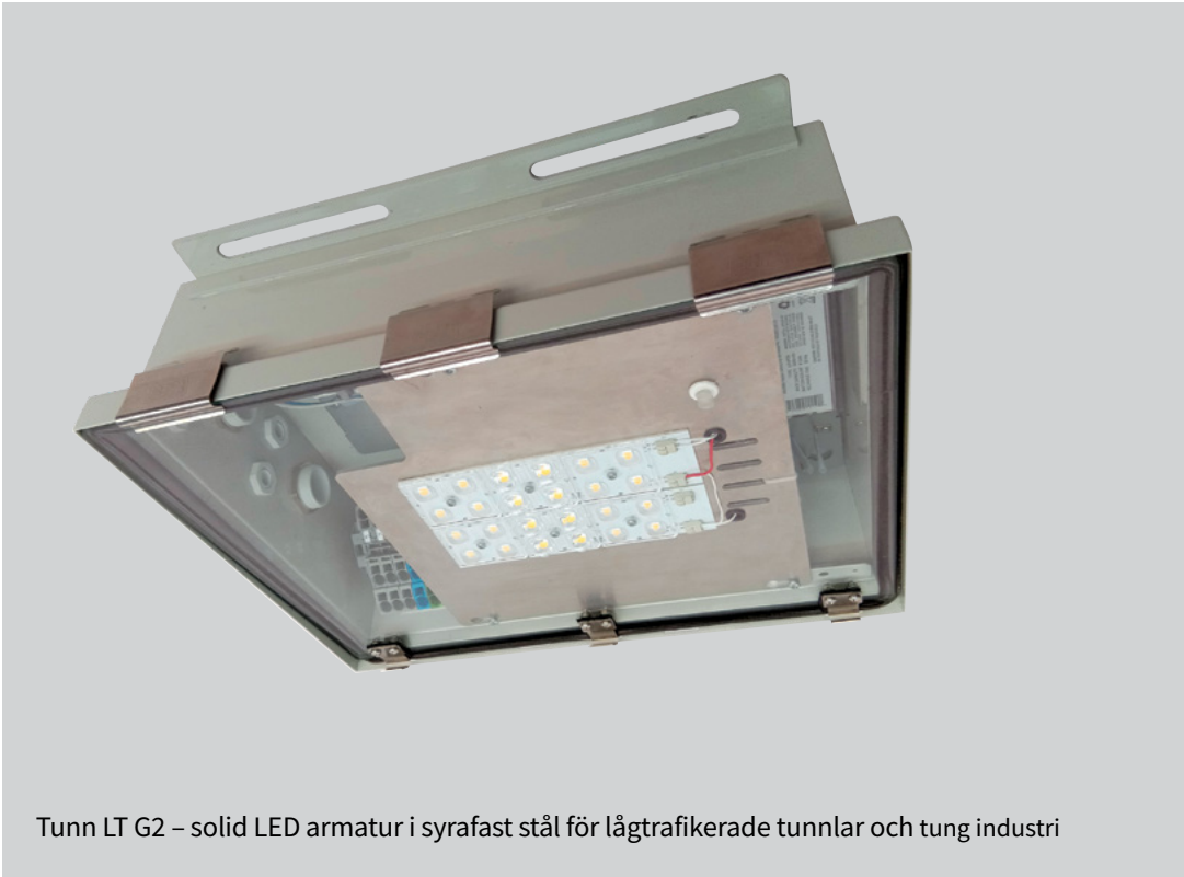
Tunn LT G2 – solid LED armatur i syrafast stål för lågtrafikerade tunnlar och tung industri