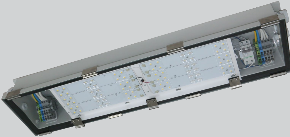
Tunn HT G2 - solid armatur i syrafast stål för högtrafikerade tunnlar och krävande industrimiljöer