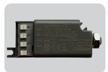
10kV overspenningsvern med LED indikator

NR = Night Reduction = Automatisk nattsenkning ihht NMF023:2023, 100% - 60% - 40% - 60% - 100%