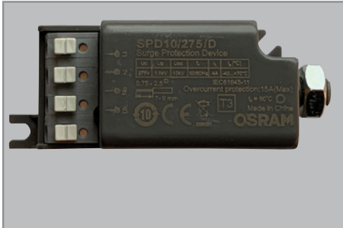
SPD 10kV Ylijännitesuoja LED indikoinnilla