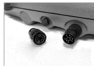
Plugg for tilkobling uten å åpne armaturen

Fargegjengivelse: Ra >80 Fargetoleranse MacAdam: 3 Omgivelsestemperatur: Ta -25°C/+45°C Levetid Ta 25: 80.000t L90B10 Levetid Ta 40: 60.000t L80B10 Vindfang: 0,265 m 2