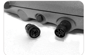
Plugg for tilkobling uten å åpne armaturen

Fargegjengivelse: Ra >80 Fargetoleranse MacAdam: 3 Omgivelsestemperatur: Ta -25°C/+45°C Levetid Ta 25: 80.000t L90B10 Levetid Ta 40: 60.000t L80B10 Vindfang: 0,265 m 2