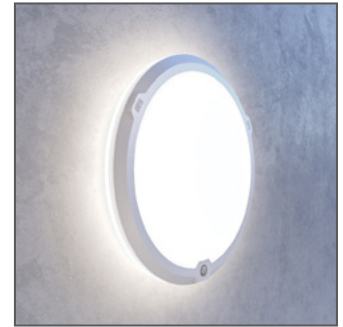
LedgeCircle tuottaa taka/sivuvaloa