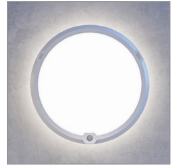
LedgeCircle PIR sensorilla