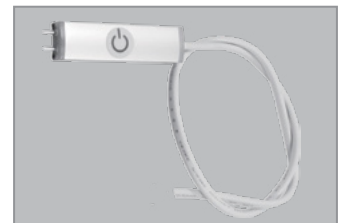
Kytentäliitin pistokkeella ja OnOff-kytkimellä