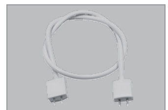
Laajennuskaapeli 0.5m; pistokeliittimet molemmissa päissä