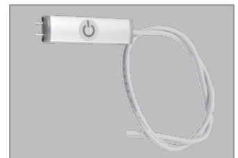
Push-in strömförsörjning med brytare