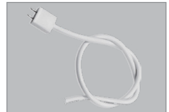
Push-in strömförsörjning utan brytare

Dimras med glödljusdimmer med bakkantsstyrning. Rekommenderad dimmer: ELKO 315GLE