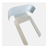
707852 - eRange Acc | Duo roof wall