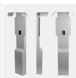
707850 - eRange Acc | Duo stand w/roof