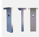
707853 - eRange Acc | Duo stand double

Fotplaten skrues til et fast underlag eller fundament med seks M12 gjengebolter.