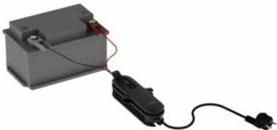
DEFA 12V Laddningskabel med klämmor

Vi rekommenderar att du låter kabeln sitta på en lätt tillgänglig plats - så du slipper leta fram batteriet när du ska ladda.